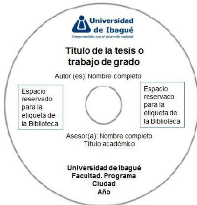
Figura 2. CD o DVD