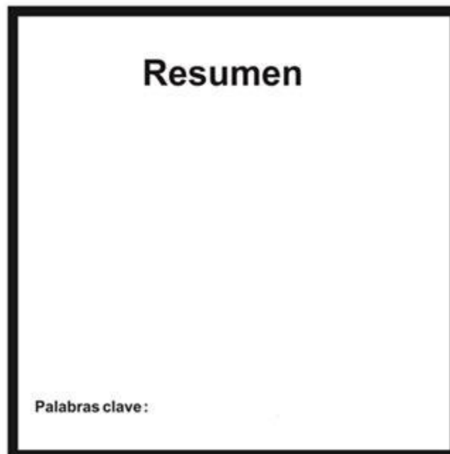
Figura 3. Reverso de la carátula